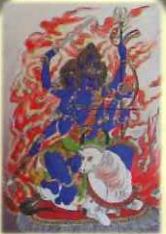
だいいどくみょうおう 西方 大威徳明王