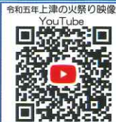
令和五年上津の火祭りの映像 YouTube