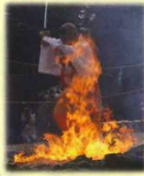
さんぶつによる火渡り修行