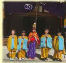
お稚見さんと子ども山伏