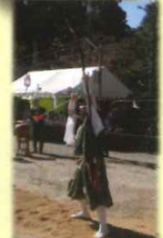
ほうこう 宝弓先達(弓の作法)