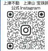
上津不動 上津山 宝珠院 公式 Instagram