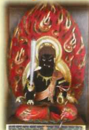
だいにちだいしょうぶ 大日大聖不動明王