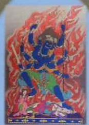
ごうざんぜみょうおう 東方 降三世明王