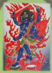
こんごうやししゃみょうおう 北方 金剛夜叉明王