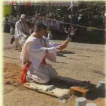
どこな 床堅先達(地固めの作法)