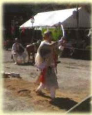
ほうけん 宝剣先達(剣の作法)